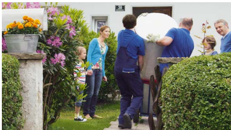
Wer seine veraltete Heizung gegen einen modernen Erdgas-Brennwertkessel austauscht, kann seine Heizkosten deutlich reduzieren. Stiftung Warentest hat im Juli neun moderne Heizkessel auf den Prüfstand gestellt

Von besonderer Bedeutung ist die Heiztechnik. Ein moderner Brennwertkessel mit optimaler Regelung kommt mit 25 bis 30 Prozent weniger Energie aus als eine veraltete Heizungsanlage. Wird nur die Heizungsregelung nachgerüstet – mit Thermostatventilen, Außenfühler und automatischer Nachtabsenkung –, bleiben die Investitionen nicht nur im Rahmen, sondern sie amortisieren sich auch relativ rasch wieder. Einfach, schnell und ohne große Ausgaben lässt sich viel Energie sparen, indem man Heizkessel,