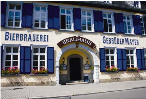
Zur Straße hin steht das zur Brauerei gehörige Gasthaus. Die gemütliche Gaststätte ist ein Oggersheimer Wahrzeichen und beliebter Treffpunkt