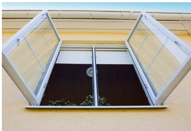
Regelmäßiges Stoßlüften ist deutlich energieeffizienter als das Lüften durch ein gekipptes Fenster. Die verbrauchte Luft wird schnell ausgetauscht und der Raum rasch wieder warm